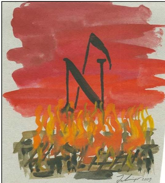
Hans Islinger: Stadtamhof am 23. April 1809

Liebe Sangesbrüder und Freunde des Liedervereins Wie schon in den letzten Chorproben angekündigt, nehmen wir am Gedenkgottesdienst der traurigen Kriegsereignisse im Jahre 1809 teil. Zur vorhergehenden Hauptprobe möchte ich alle Chormitglieder um ihre Teilnahme bitten. Wir treffen uns in Sängerkleidung um 9.30 Uhr in unserem Probenlokal. Im Gottesdienst werden die beiden Chorsätze aufgeführt, die in den letzten Chorabenden geprobt wurden.